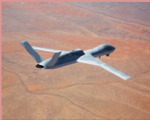
Predator C Avenger

Les drones ne sont plus un sujet futuriste tant ils se sont imposés dans les opérations. Ce qui demeure un véritable sujet est leur emploi dans les opérations. À ce titre, la présentation du drone Predator C Avenger offre des pistes de réflexions intéressantes, à l'instar du concept TERN développé par l'US Navy :