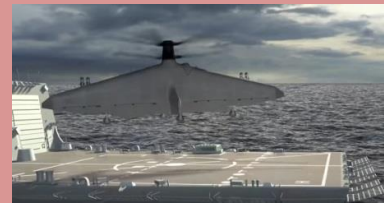
US Navy Concept TERN

Ce concept, parfois cité sous le terme de « marsupialisation » des plates-formes de combat, laisse augurer de l'emploi de petits drones formant un essaim de protection, de reconnaissance ou d'action autour du combattant terrestre de demain.